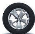
Rin aluminio de 16" (Intens TM)