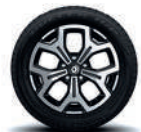
Rin aluminio bitono de 17" (Iconic CVT)