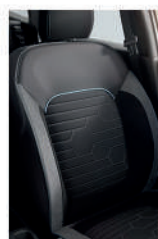
Asientos de tela con detalles tipo piel